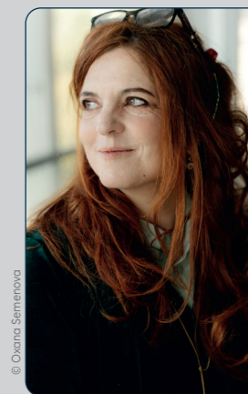
Agnès JAOUÏ Présidente