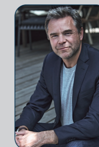
Guillaume DE TONQUEDEC